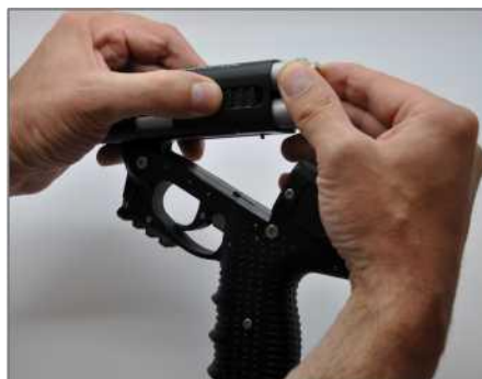
Odstránenie z kanistrov.