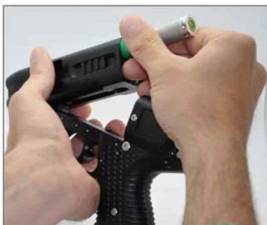
Nabíjanie jedného kanistra - zásobníka.