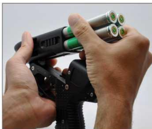
Nabíjanie 4 kanistrov naraz pomocou rýchlonabíjača.